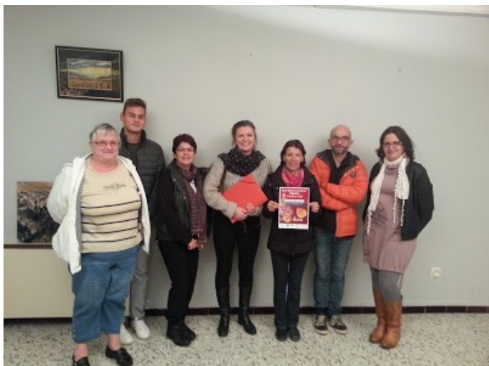
Délégation de Saint-Martin venue à Aiguèze pour une séance de travail