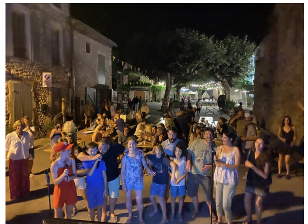
REPAS TIRÉ DU SAC