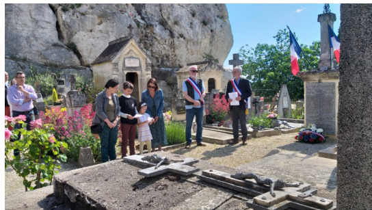
Cérémonie du 8 mai