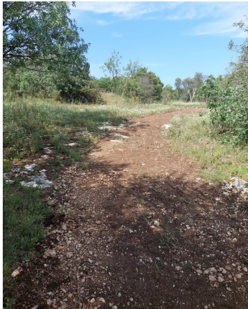
Traçage d'un chemin de découverte au départ du GIET et installation de 5 tables de Pique-niques