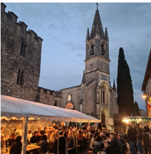
REPAS PAYSAN (DE FERME EN FERME