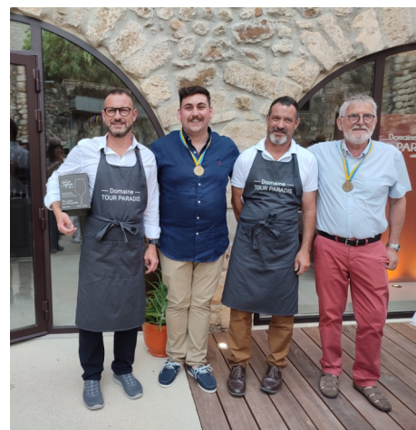
INAUGURATION DU CAVEAU TOUR PARADIS