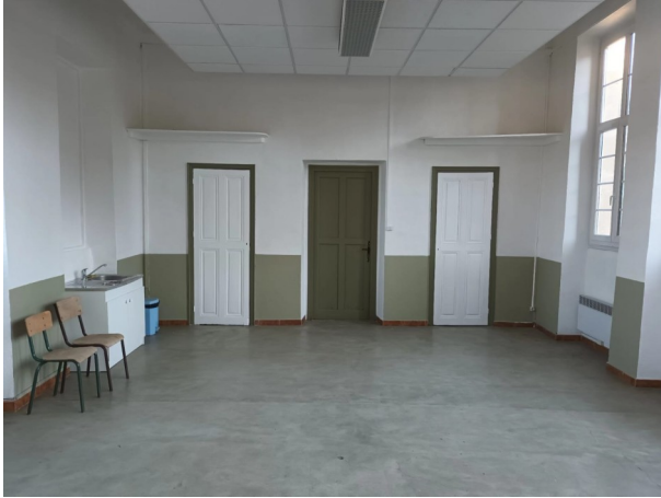
Nouvelle peinture pour l'ancienne école