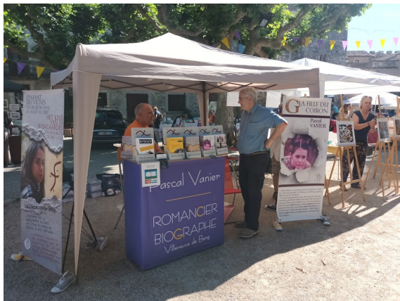
SALON DES ECRIVAINS ET PHOTOGRAPHES