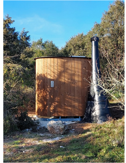
Toilettes sèches pour l'aire du GIET