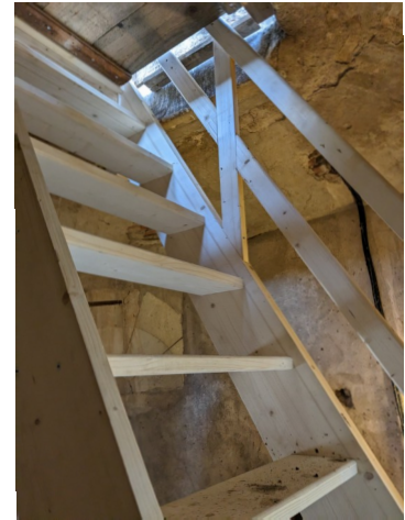
REPLACEMENT DE L'ESCALIER DU CLOCHER