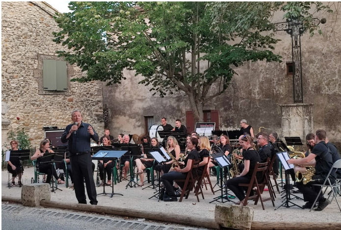
HARMONIE DE LIMONEST