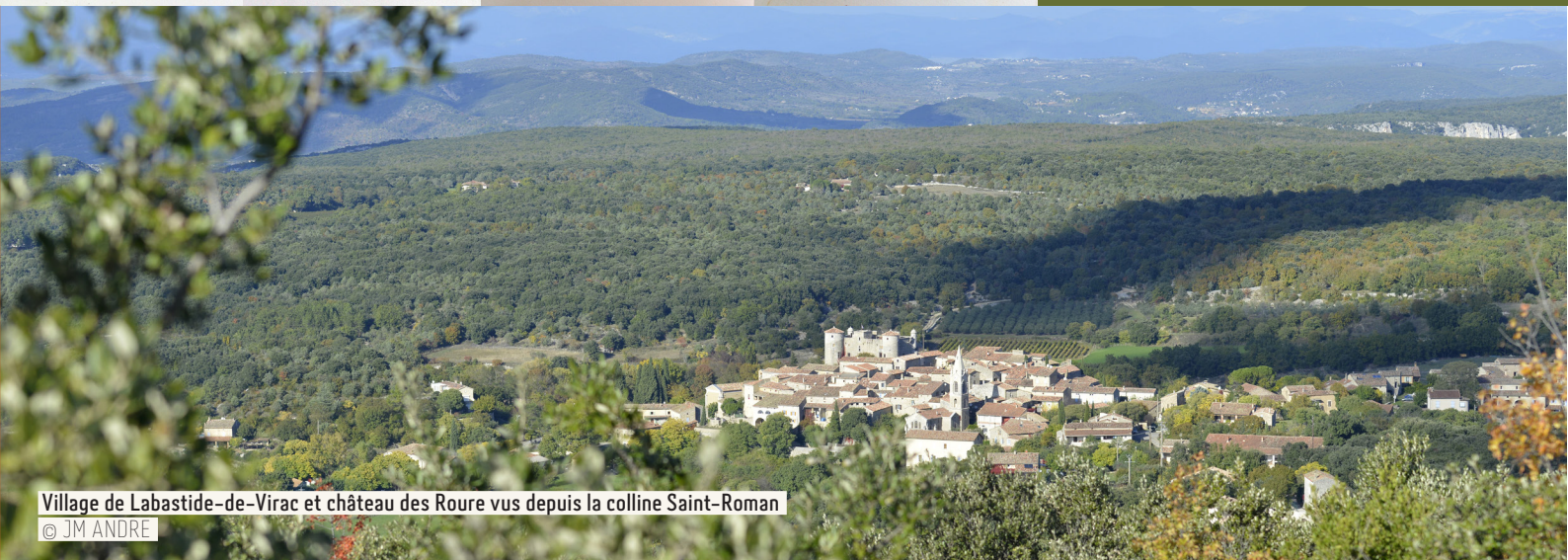
Village de Labastide-de-Virac et château des Roure vus depuis la colline Saint-Roman