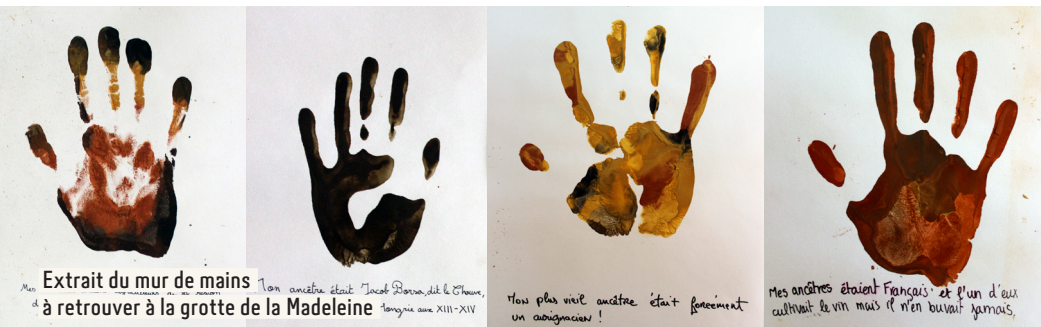
Extrait du mur de mains