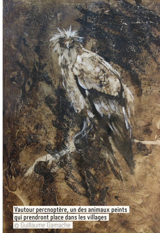
Vautour percnoptère, un des animaux peints qui prendront place dans les villages

Et vous, quel est votre rapport aux gorges de l'Ardèche ?